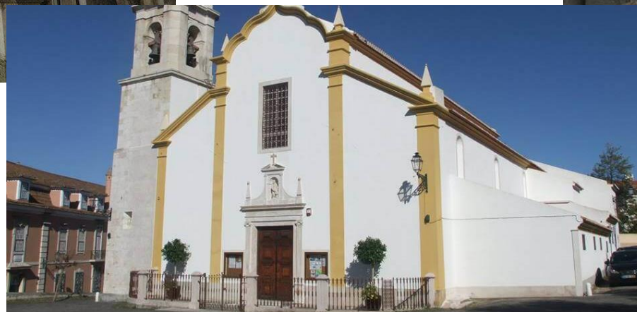
Igreja de São João Baptista do Lumiar