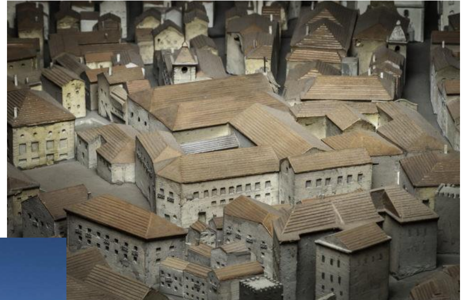
Convento da Santíssima Trindade | Museu de Lisboa | Maqueta de Lisboa antes do Terramoto de 1755 | Pormenor | José Vicente, 2013