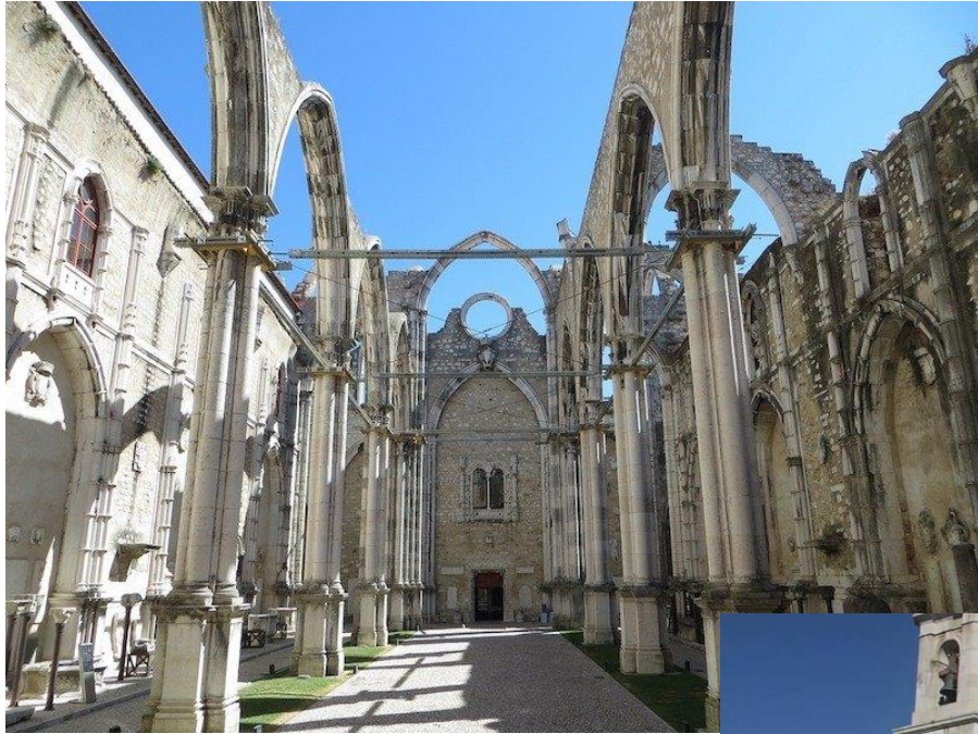
Convento do Carmo