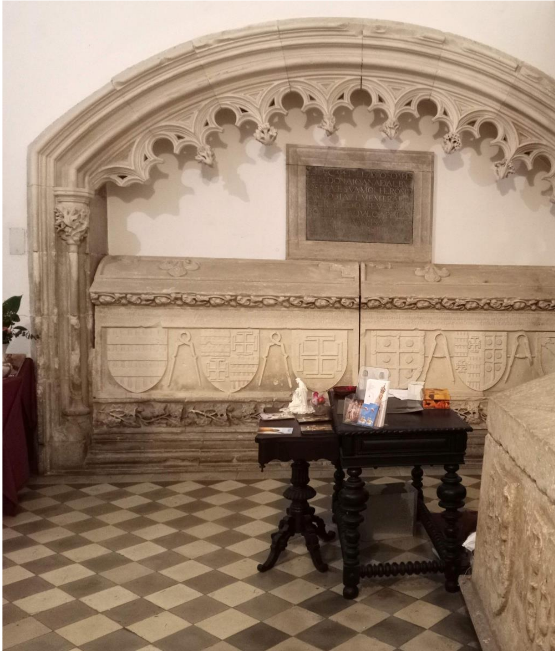
Capela de Lopo Soares de Albergaria, Convento da Graça