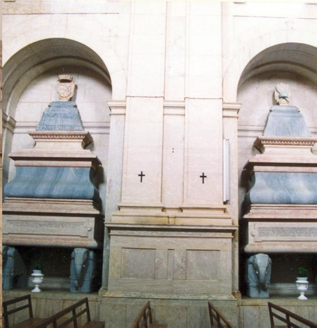
Capela de D. João de Castro em S. Domingos de Benfica.